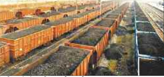
बिना तिरपाल के कोयला परिवहन करती मालगाड़ी।

हरिभूमि न्यूज ►► कोरबा रेल प्रबंधन बिना तिरपाल ढंके रोजाना 40 से 45 रैक कोयला से लदी मालगाड़ियां शहर के बीच में दौड़ा रही है। इससे कोल डस्ट वातावरण में घुल रही है। पर्यावरण दूषित हो रहा है, लेकिन जिम्मेदार विभाग रेल प्रबंधन पर कार्रवाई नहीं कर रहा है। दक्षिण पूर्व मध्य रेलवे बिलासपुर अंतर्गत कोरबा के गेवरा, दीपका, कुसमुंडा, जूनाडीह व मानिकपुर साइडिंग से कोयला परिवहन किया जा रहा है। मालगाड़ियां शहर से होकर गुजर रही हैं। इसके बाद भी रेल अफसर पर्यावरण प्रदूषण जैसी समस्या को लेकर गंभीर नहीं है। रेल प्रबंधन की ओर से कोयला लदान के लिए लोगों की सुविधाओं तक को ध्यान नहीं दिया जा रहा है। एक ओर जहां साइडिंग पर कोयला लदान के दौरान पानी का छिड़काव नहीं किया जा रहा है, वहीं दूसरी तरफ मालगाड़ी के वैगन में