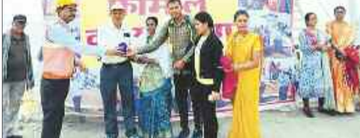
हादसों के बारे में परिजनों को जानकारी देते सेप्टी एक्सपर्ट।

हरिभूमि न्यूज ►► कोरबा कोयला खदानों में होने वाले हादसों पर रोक लगाने एसईसीएल ने एक नई पहल की है। एसईसीएल प्रबंधन द्वारा अब कोल कर्मियों के परिजनों को भी सुरक्षा के गुर बताए जा रहे हैं। एसईसीएल गेवरा प्रबंधन ने खान सुरक्षा